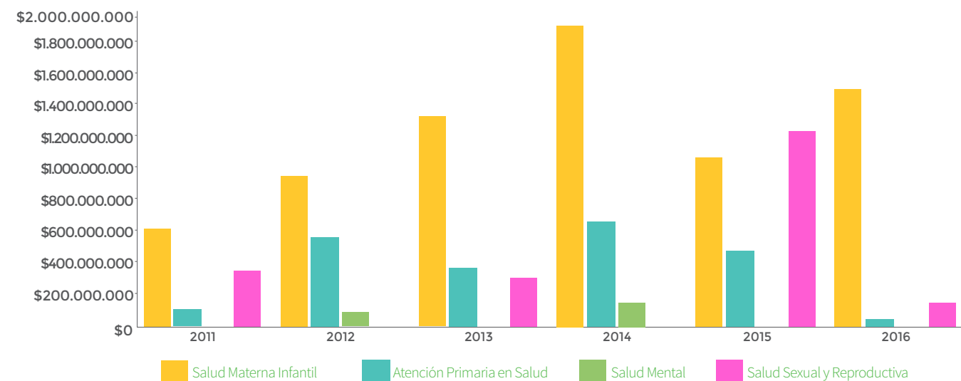
Recursos recibidos por línea de acción 2016 por fuente de financiación